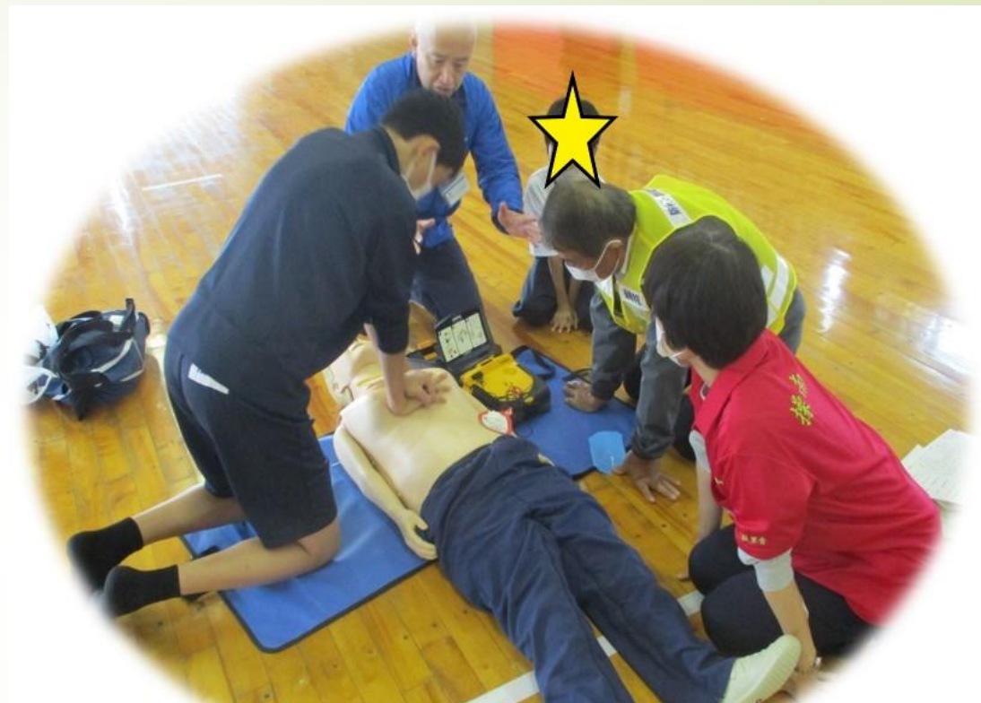
もしもに備えた救急対応エリア