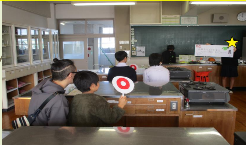
【協力】 岡山市危機管理室