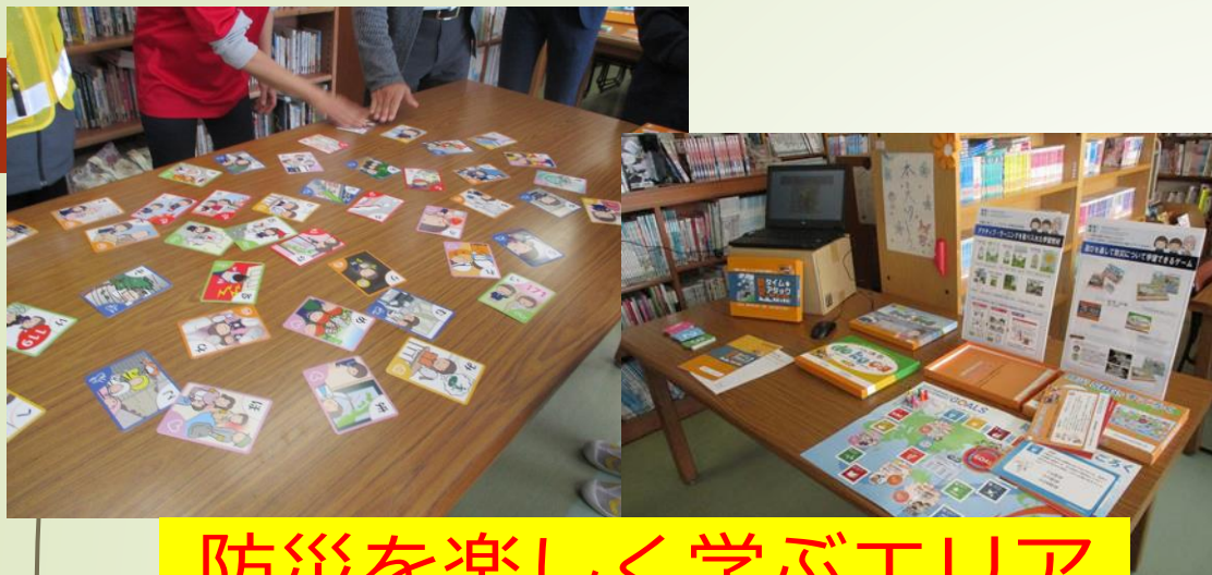
防災を楽しく学ぶエリア