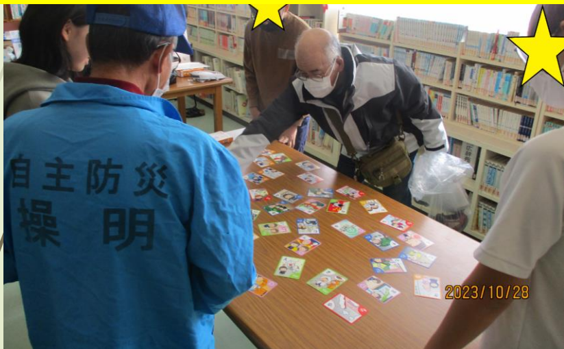
【協力】 明石スクールユニフォームカンパニー