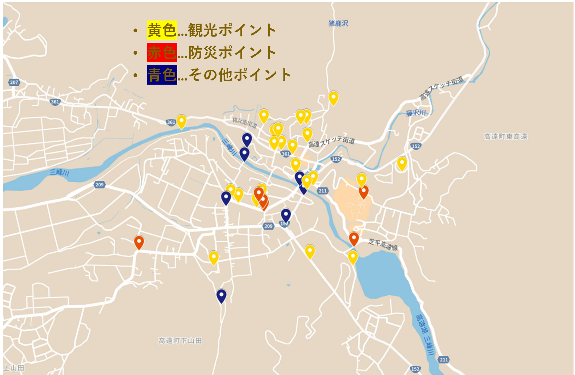
1年生作成の観光防災マップの一部