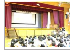
「荒川の治水について」 ぼうさいこうえんかい 防災講演会 (全校)