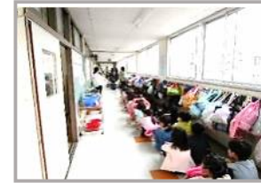
ひなんくんれん 避難訓練<高所> (全校)