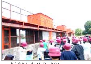
あらかわすいりょうかん 荒川治水資料館

りか 理科「雨水の流れ」 しゃかいが 社会科「自然災害から人々を守る活動」(4年)