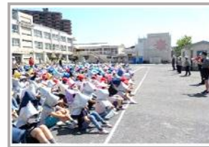
ひなんくんれん 避難訓練<地震> (全校)