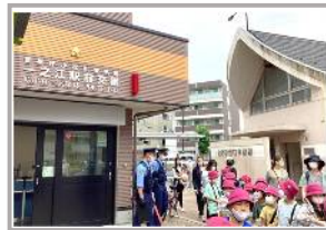
まちたんけん 町たんけん (2年)