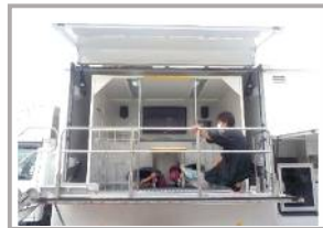
きしんしゃたいけん 起震車体験 (5年)