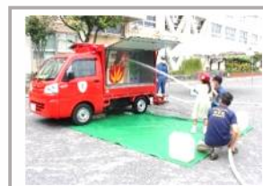
ぼうさい 防災チャレンジ (全校)