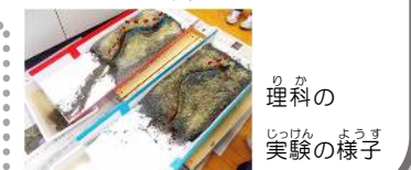
りかの 理科の 実験の様子

りか 理科「流れる水のはたらき」 しゃかいが 社会科「自然災害から国民を守るための対策」(5年)