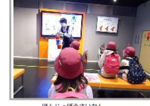
ほんしょぼうさいかん 本所防災館 ぼうさいしせつけんがく 防災施設見学 (3・4・5年)