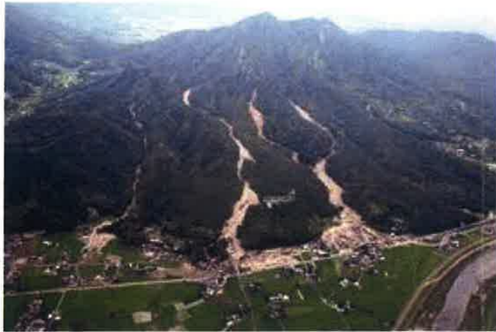
水の自遊人しんすいせんたいアカザ隊 作成